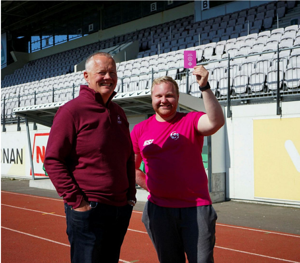
Bleika spjaldið vakti verðskuldaða lukku á Síamótinu

Hugmyndir sem stundum hafa heyrst í opinberri umræðu um að „klúbbarnir eigi bara að láta þjálfarann ráða öllu” og einhverjar stjórnir eigi ekki að vera að skipta sér af sýna litla innsýn í það hvernig stórar og fjölbreyttar knattspyrnudeildir eru reknar árið 2023.