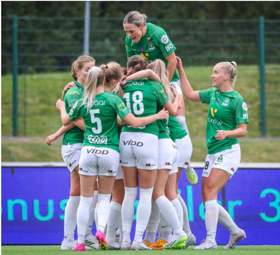
Stelpurnar fagna marki