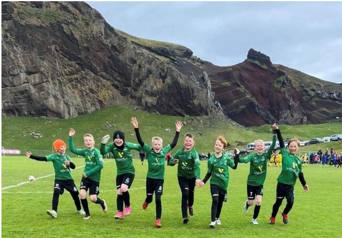
Kátir Blikar á Eyjamóti

Þar að auki sendir Breiðablik fjölmenna hópa á flest knattspyrnumót hérlendis sem og að sækja afreksmót erlendis með eldri flokkana. Er það hluti af starfseminni sem fer vaxandi og gefur ungum iðkendum færi á að bera sig saman við jafnaldra á háu getustigi.