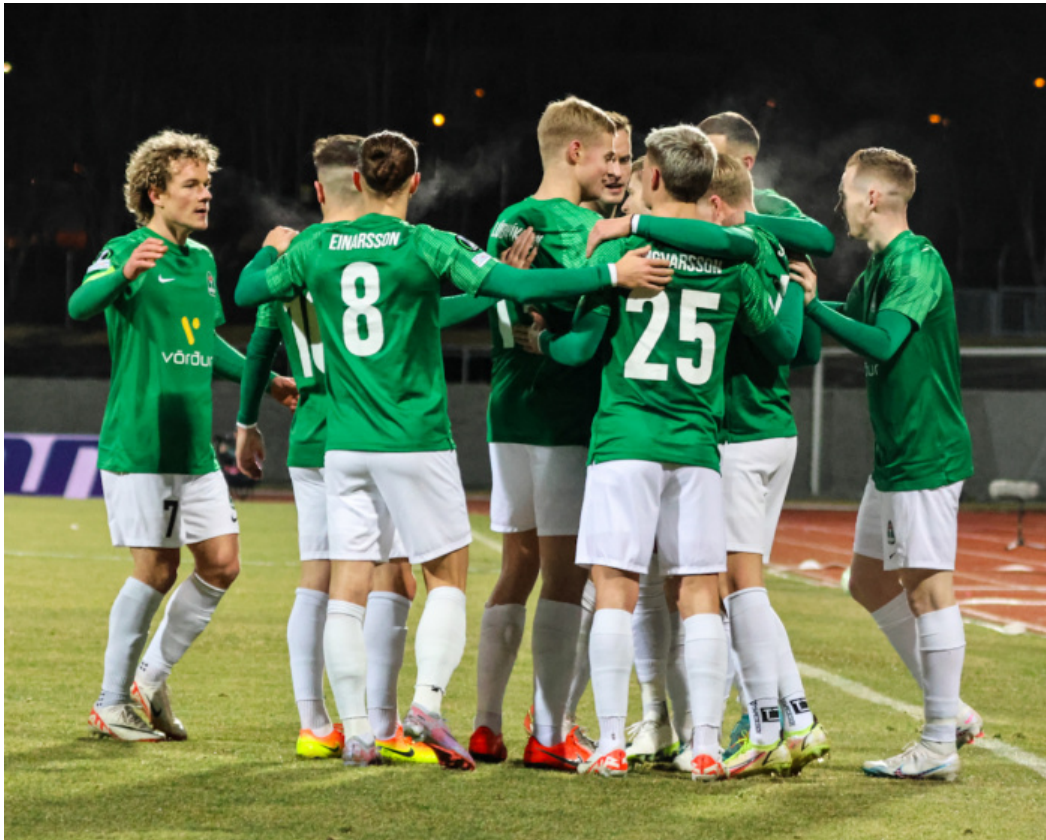
Strákarnir fagna marki á Laugardalsvelli