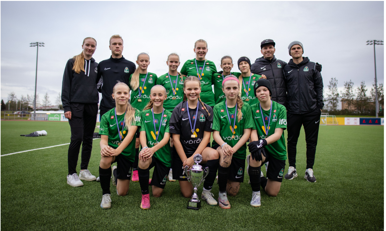
5 flokkur kvenna sigursælar árið 2023