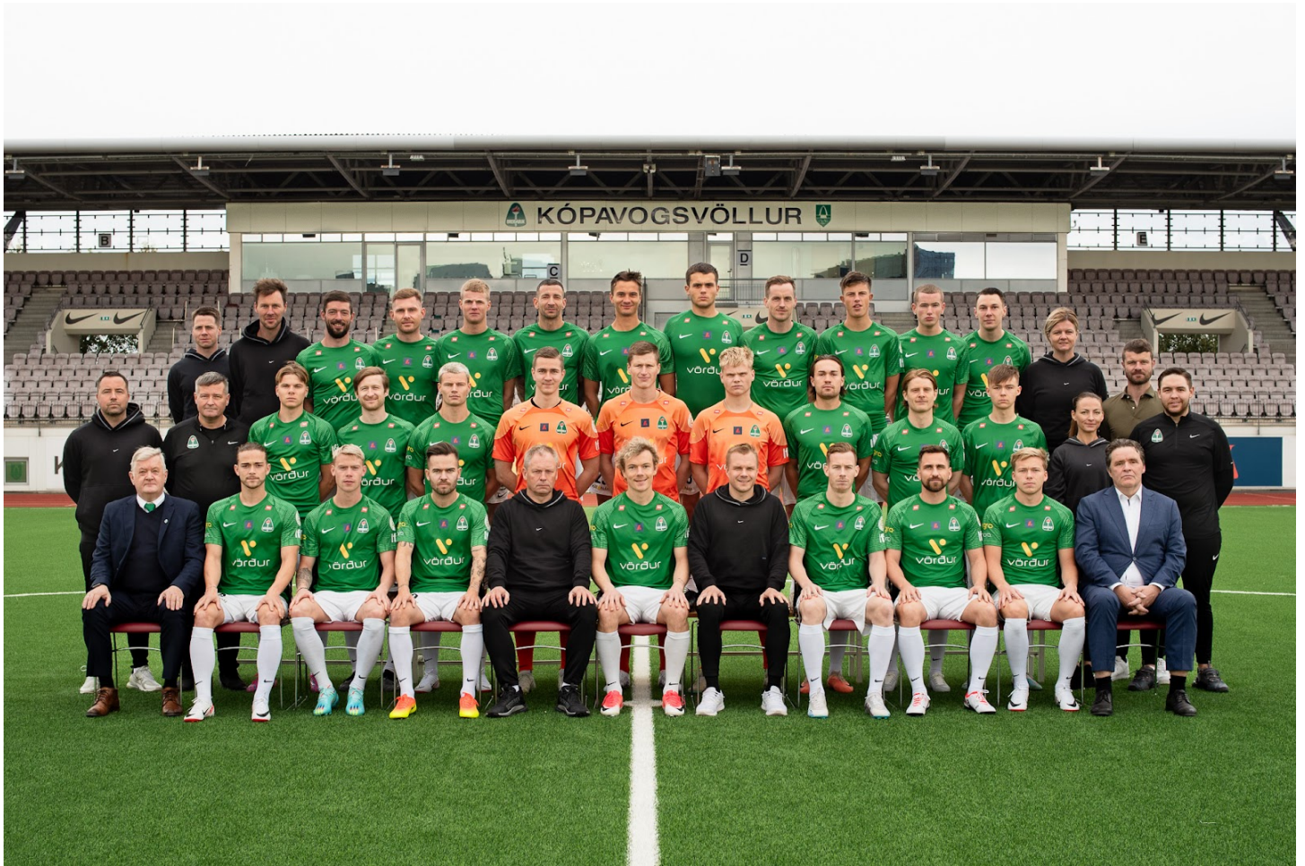
Meistaraflokkur karla 2023