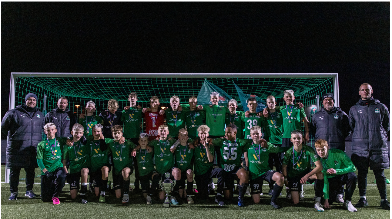
4 flokkur drengja Íslands- og bikarmeistarar