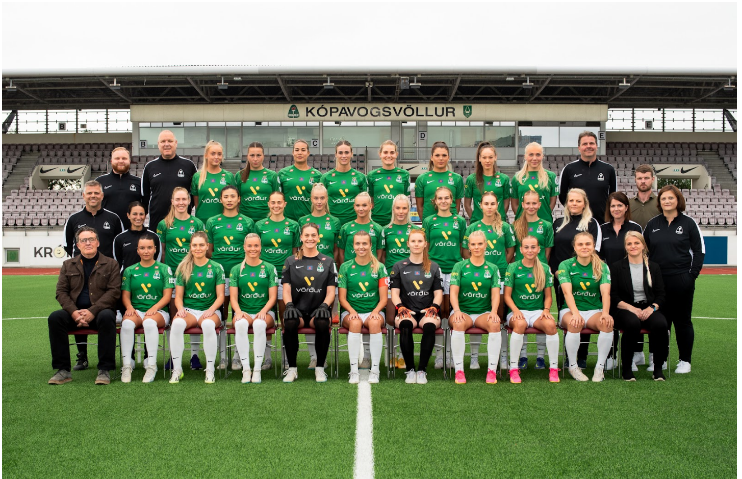
Meistaraflokkur kvenna 2023